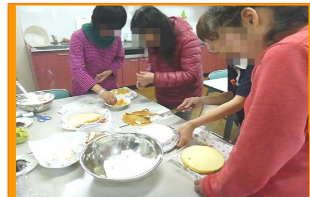
生クリームを丁寧に塗ります。

火・土デイケアでは、 24日イブの日にクリスマス会がありました。初めてのクリスマス会！という方が多く、前回参加したメンバーが、ケーキ作りの工程など丁寧に教えていました。見た目も味も最高のケーキが完成！皆でコーヒー・紅茶を飲みながら美味しく頂きました。クイズ、ビンゴゲームで盛り上がった後は、賞品のプレゼントを選びました。今年の景品は、気に入ってもらえたでしょうか。