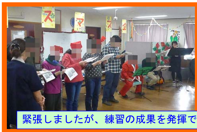
緊張しましたが、練習の成果を発揮できました