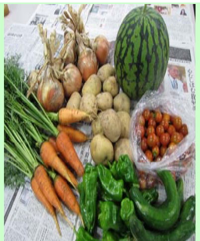
今年も農園で採れた立派な野菜たち