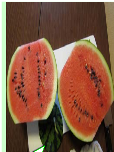
まっ赤に色付いて食べごろのスイカ