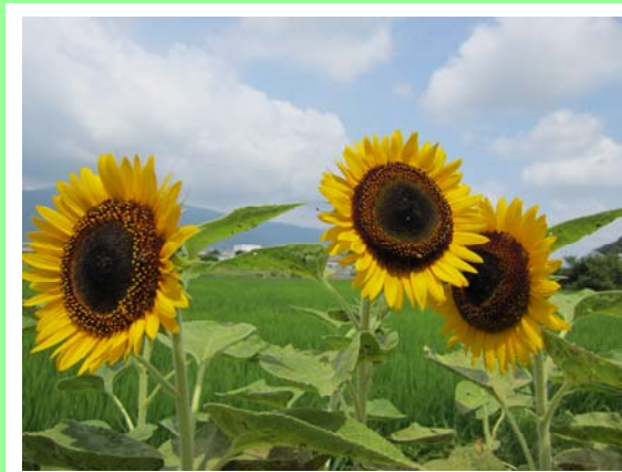
お日様に向かって力強く咲いている向日葵

これから秋冬の野菜を作っていきます。新しい土壌で今まで以上に立派な野菜が収穫できることを期待して、農園の作業に励んでいきたいと思えます。