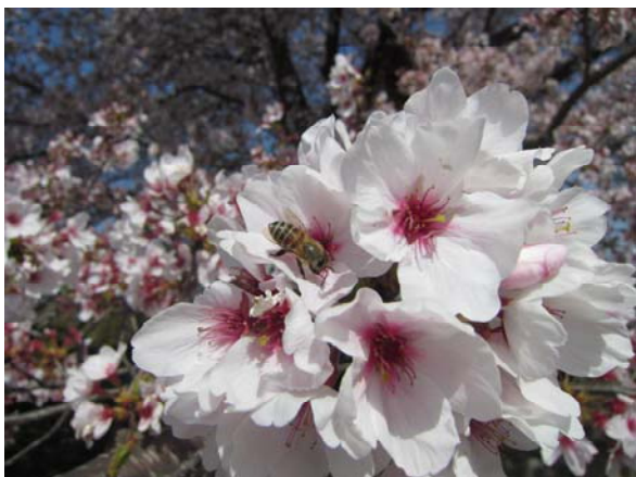
ミツバチが特等席でお花見