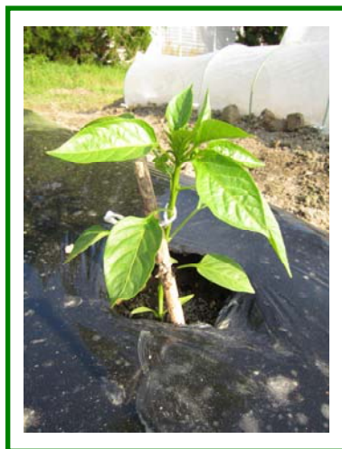
ピーマン植えました！