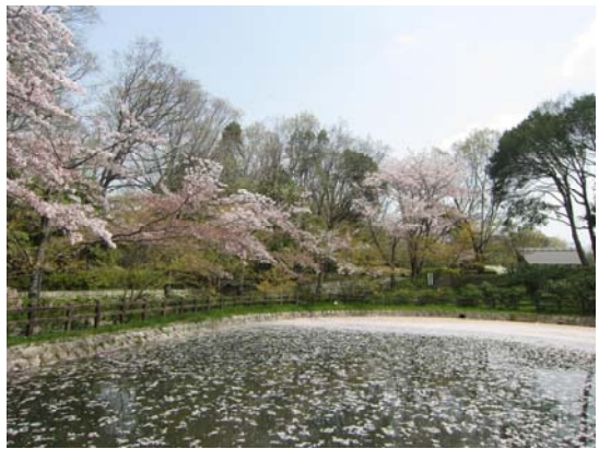
水面に浮かぶ桜もキレイ♪