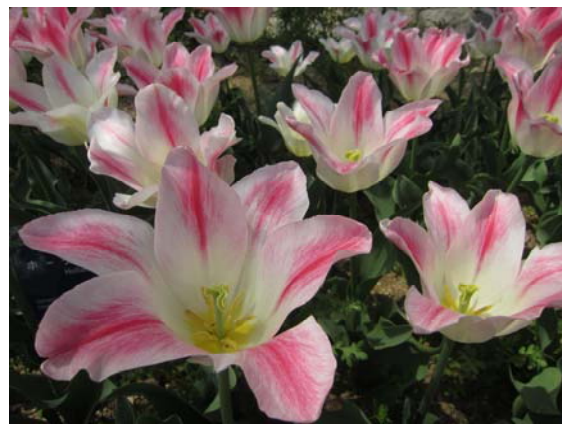
ホーランドチックと言います