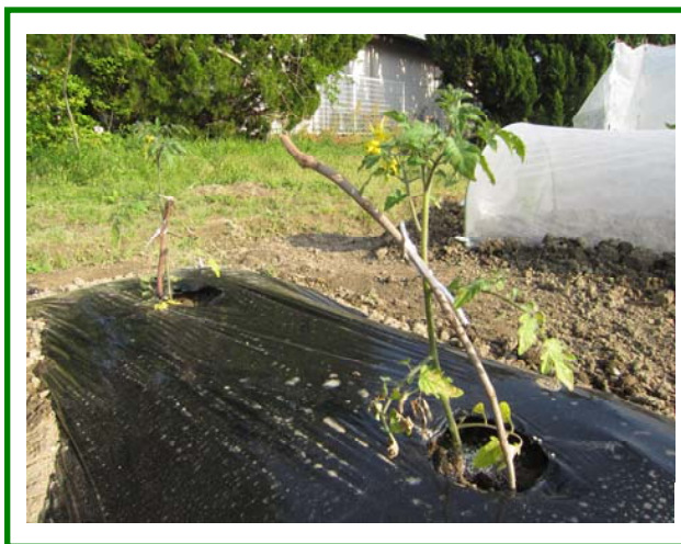
ミニトマトも植えました！！