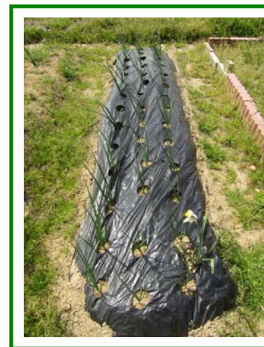
玉ねぎどんどん大きくなってます♪