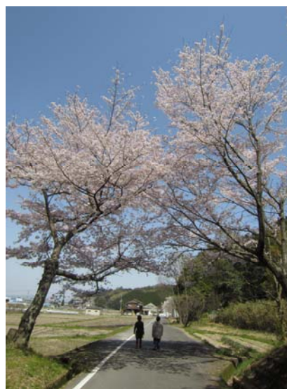
桜のアーチ素敵でした♪