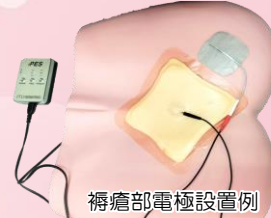
褥瘡部電極設置例

最近では、褥瘡予防・管理ガイドラインにおいて推奨されている電気刺激療法を取り入れています。ひとでは感じることでできない程度の微弱直流電気刺激を用い、細胞を刺激することで、分化の促進や活性化をもたらすと言われていています。当院では、医師・看護師・理学療法士がチームで取り組んでいます。