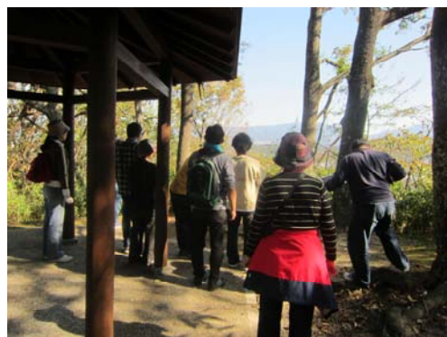
県境の山々が見えました！