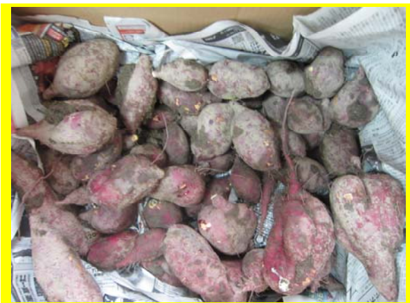
皆でさつまいもを収穫しました♪