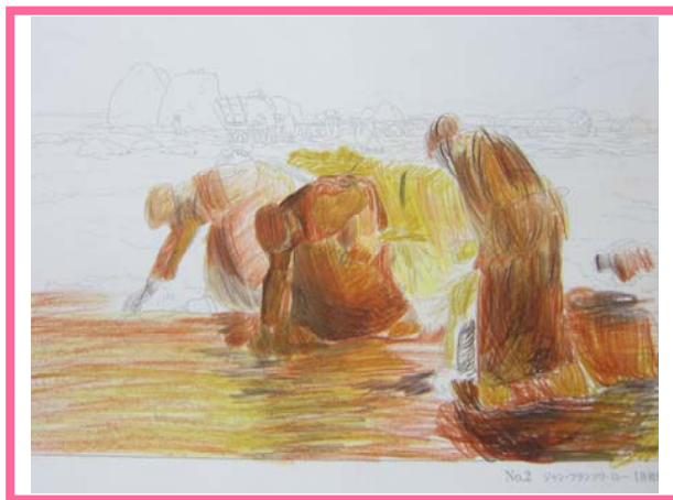
色鉛筆での塗り絵

『油絵のようなタッチに仕上がりました！！』 『丁寧に塗って、満足できる作品になりました』