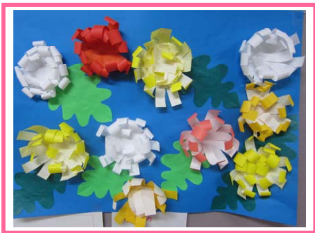
菊のハーモニー(折り紙)