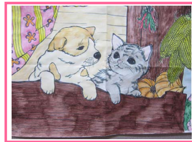
色鉛筆を水で伸ばした水彩画

『油絵のようなタッチに仕上がりました！！』 『丁寧に塗って、満足できる作品になりました』