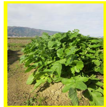
大根もどんどん成長中♪