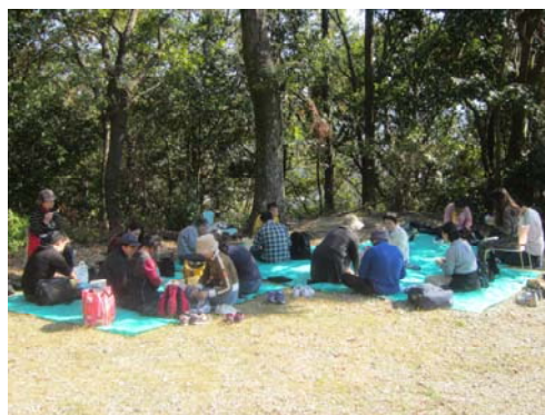
外で食べるお弁当は美味しい♪