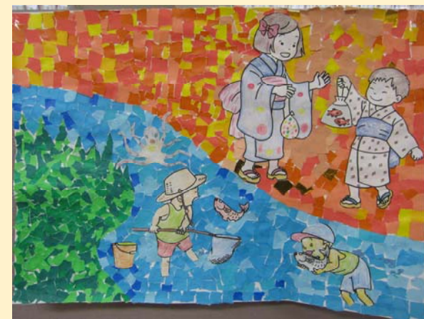
貼り絵とぬり絵で夏の夕暮れを表現。みんなで作りました。