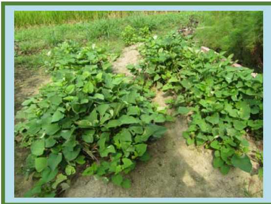
サツマイモもぐんぐん成長中！