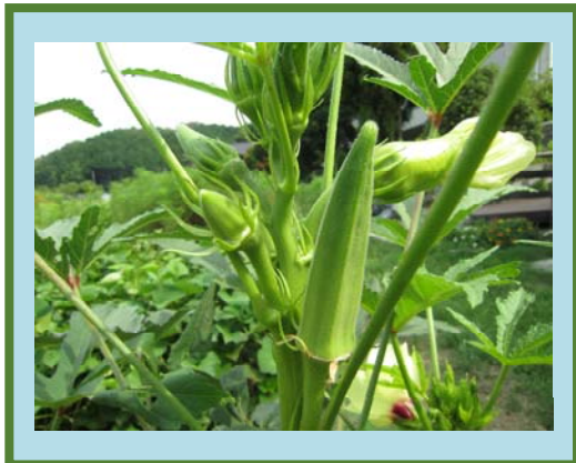
オクラがどんどん出来てます