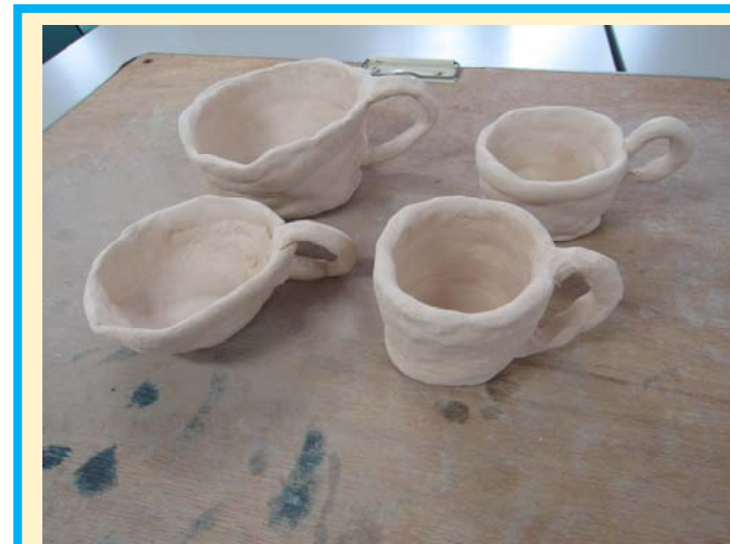
陶芸作品。素焼きをしました。次は釉薬をつけて、本焼きです！