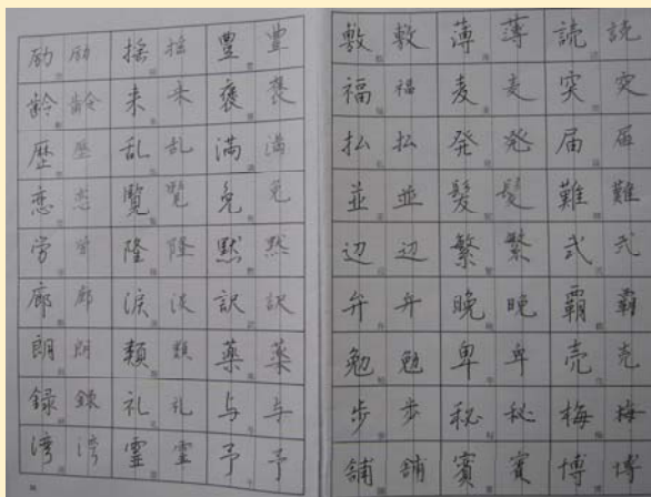
硬筆で綺麗な文字を書いていただきました。