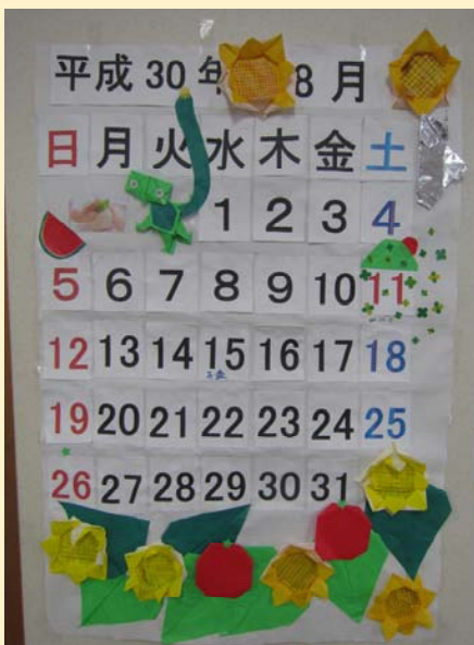
夏らしさ満載！8月のカレンダー

デイケアでは創作プログラムや個人活動で、月々のカレンダーや季節の飾りを作っています。他にも革細工、アイロンビーズ、陶芸といった個人で作る作品もたくさんあります。今回はその中の一部を紹介します。