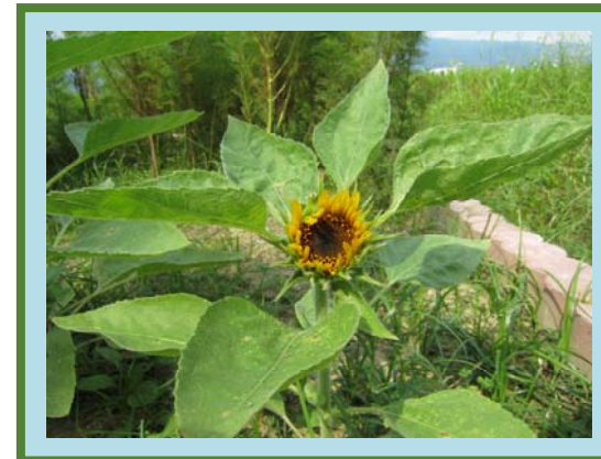
ヒマワリが遂に咲きました！