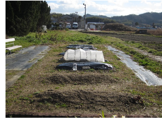
春に向けて準備中...