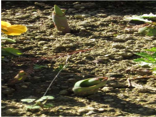
チューリップの芽が 出始めました