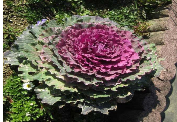
葉牡丹が綺麗です