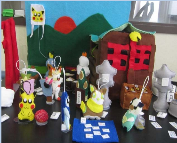
マスコット (ポケモン)