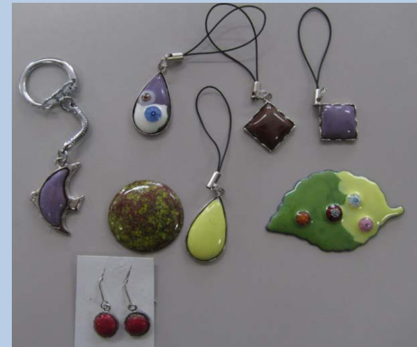
～ 七宝焼き ～