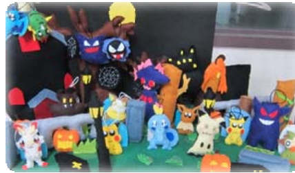
ハロウィン(ポケモン)