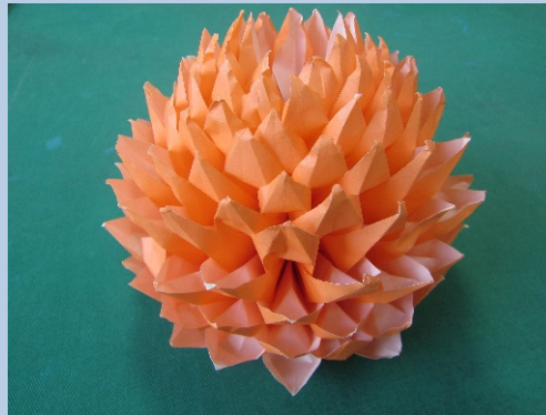
折り紙作品 ダリア