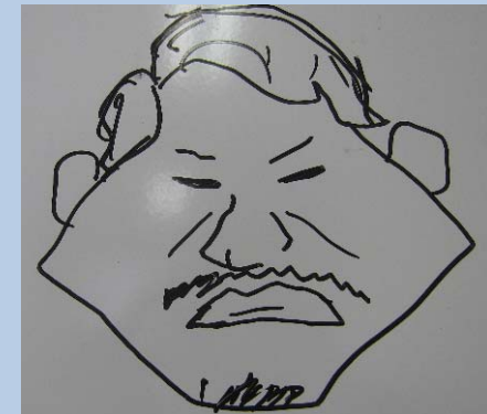
似顔絵クイズ(政治家編+α)