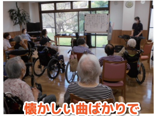
懐かしい曲ばかりで いい思い出が甦ります！