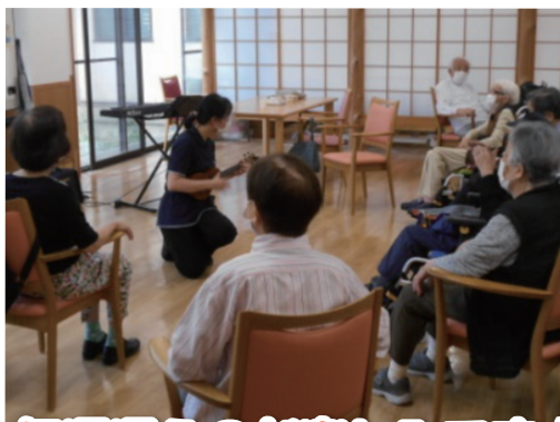
毎週通うのが楽しみです☆

感染症により音楽療法を一時的に中断してましたが、再開しています！マスク着用や換気・人数制限など感染予防を継続しつつですが、音楽を通して利用者間の交流や沢山の笑顔が溢れています！