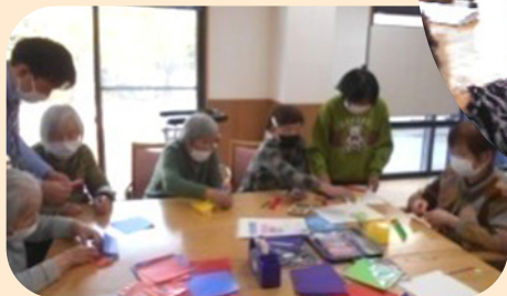
わいわい作品作り